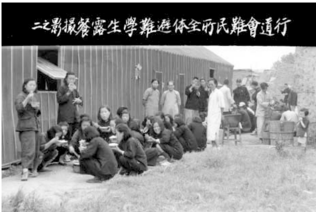
Flyktinglägret Hsinho utanför Wuchang i oktober 1948.

Verksamheten bedrevs genom listinsamling av pengar men också insamling av linne och bomull till förbandsmaterial. Insamlingen genomfördes av särskilda lokalkommittéer, som vid halvårsskiftet 1938 uppgick till 110 st. Redan i februari 1938 avseglade den första sändningen läkemedel och sjukvårdsutrustning från Göteborg till Kina, där Kinas