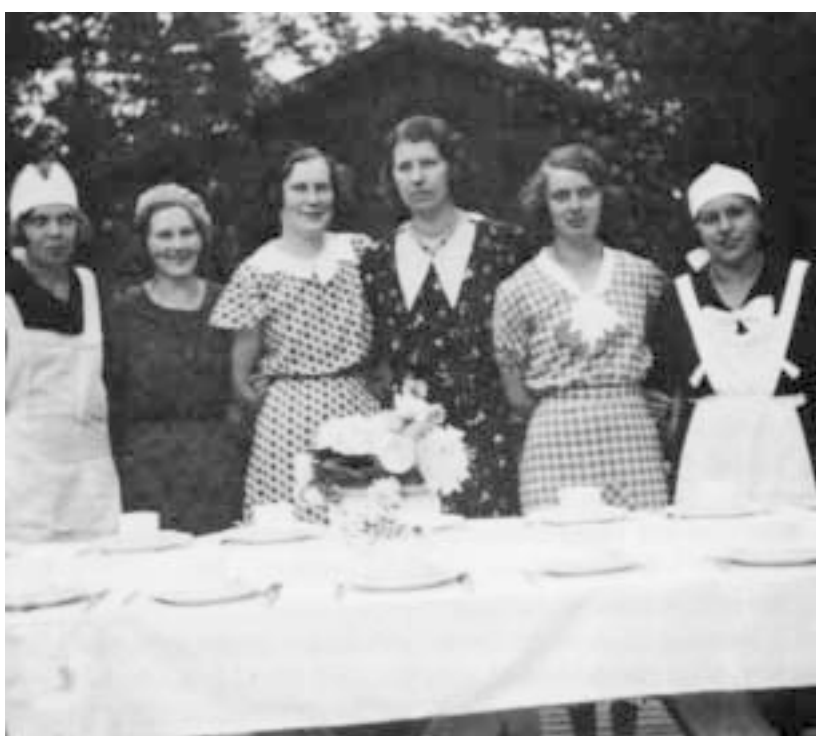
»Systrarnas afton« vid Pershyttans dansbana 1934.