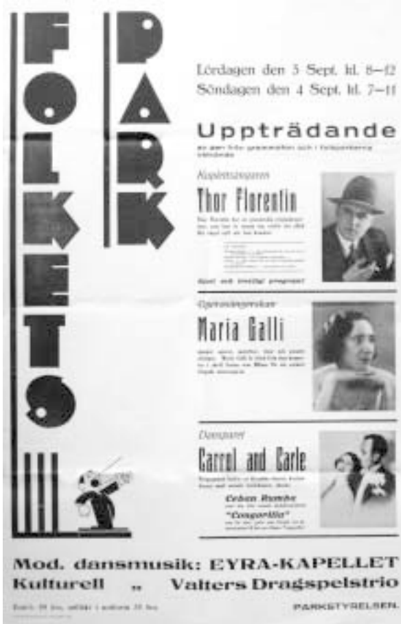
Affisch från 1932.