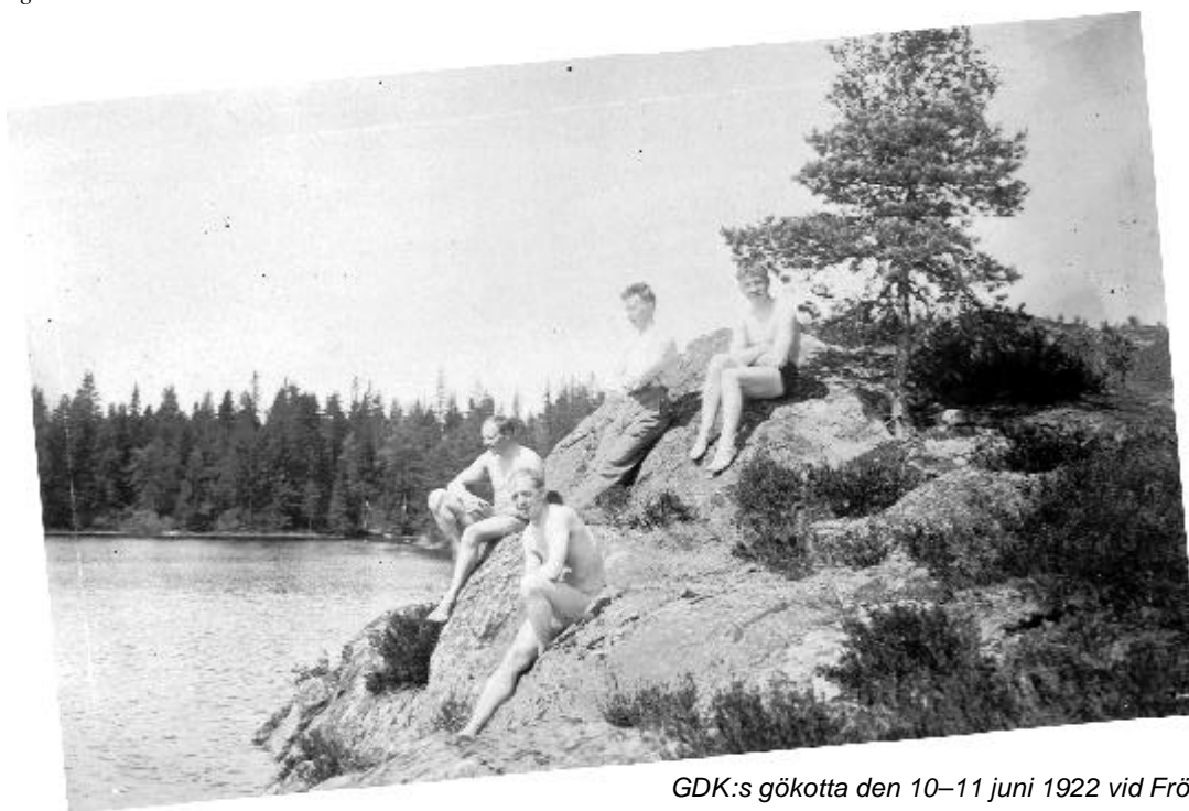
GDK:s gökotta den 10–11 juni 1922 vid Frösvidal.

Och därför, högt ert huvud håll I bröder G.D.K.-are. Ty känt skall bli åt alla håll, ej finns det gossar "blåare" än som i G.D.K. och våra loger stå. Till sist ett "hell" från systrar små - Lyckan följ G.D.K. - .